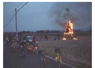
2月11日どんど焼き