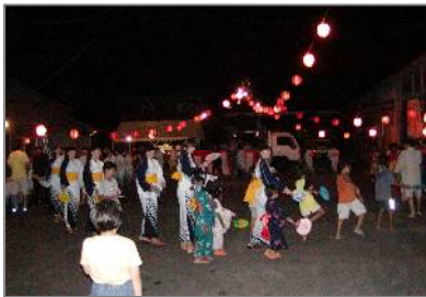
佐知地区盆踊り お疲れ様でした!

SAN・SUN カーニバル、川遊び、盆踊り、島根行きと忙しい夏休みでした。秋もまた忙しくなります。