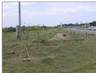
すっかりきれいになりました

去る、7月7日の日曜日に突然でしたが、1月に植えた桜の木周りの草刈りをしました。草も伸び、かずらもまかりついて、数本枯れかかっているのもあり心配していました。10人ほどで30分で終わりました。枯れかかっていた木も芽が出ていたので安心しました。